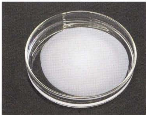
2 | Fällung von Silberchlorid während der kreisförmigen Ausbreitung der Silbernitrat-Lösung