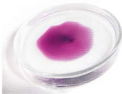
1 | Kaliumpermanganat löst sich in Wasser